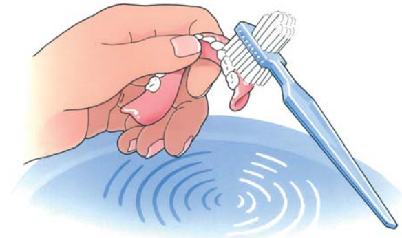
Reinig uw kunstgebit na iedere maaltijd

Uw kunstgebit is nu nog nieuw en mooi. Dat wilt u natuurlijk graag zo houden. Daarom moet u, net als bij eigen tanden en kiezen, uw kunstgebit verzorgen. Als u het niet regelmatig schoonmaakt, blijven er voedselresten achter. Zowel op uw kunstgebit als eronder. Als u die niet verwijdert, kan uw tandvlees op den duur gaan ontsteken. Reinig uw gebit daarom zorgvuldig na iedere maaltijd. Gebruik een speciale protheseborstel, bijvoorbeeld van Lactona of Oral-B, en water om etenresten goed te verwijderen. Gebruik géén tandpasta. Die kan te veel schuren. Een schoon kunstgebit voelt altijd glad aan. Laat uw gladde gebit tijdens het reinigen niet uit uw handen glippen. Het zal kapot gaan. Vul voor de zekerheid eerst de wasbak met water en reinig uw gebit daarboven.